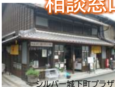
シルバー城下町プラザ